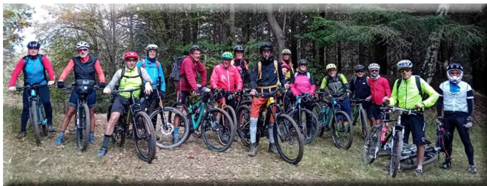
Il Biellese tra Bessa e Serra