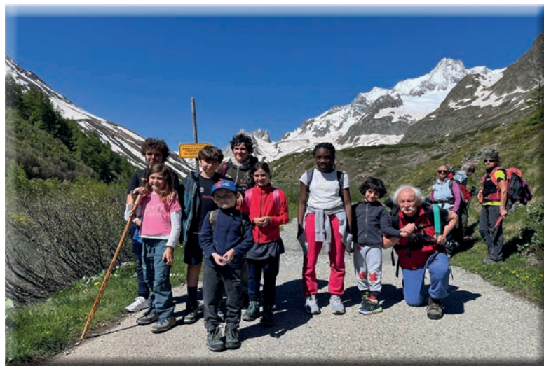
Alpinismo Giovanile in Val Veny dal rifugio Monte Bianco