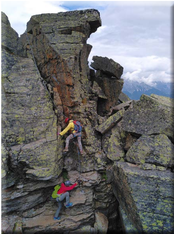
Alta Via dell'Inntal

Le uscite sono previste nelle seguenti date: