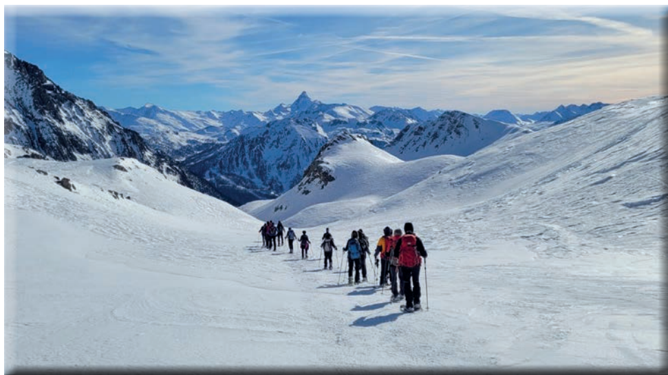
Trois Freres Mineurs