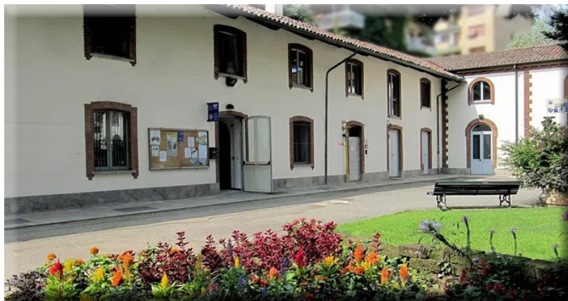
La nostra Sede UGET